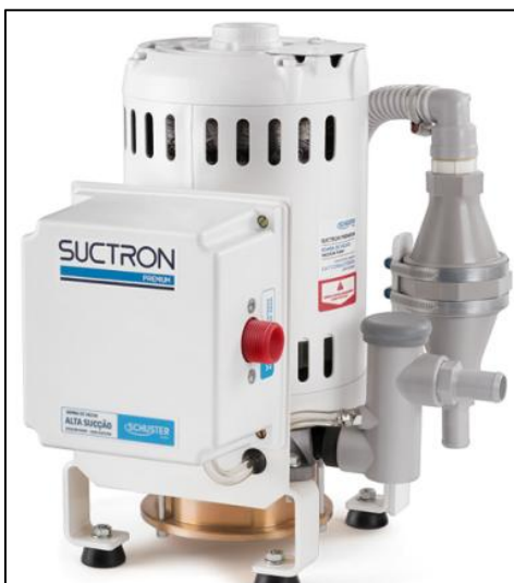
Figura 6 - Imagem ilustrativa do sistema de vácuo odontológico.

Como referência para seleção do equipamento, utilizou-se a linha de bombas de vácuo da empresa Suctron.