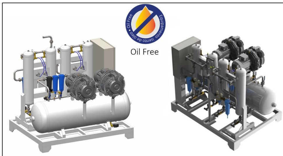
Figura 1 - Imagem ilustrativa do sistema de fornecimento de ar comprimido medicinal Airmed Oil