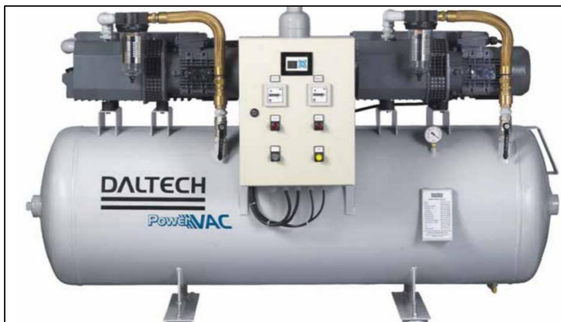
Figura 2 - Imagem ilustrativa do sistema de fornecimento de vácuo clínico VAC