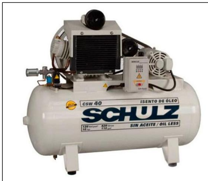
Figura 4 - Imagem ilustrativa do sistema de fornecimento de ar comprimido odontológico

Como referência para seleção do equipamento, utilizou-se a linha de compressores isentos de óleo da empresa Schulz, do tipo de montagem sobre tanque (reservatório).